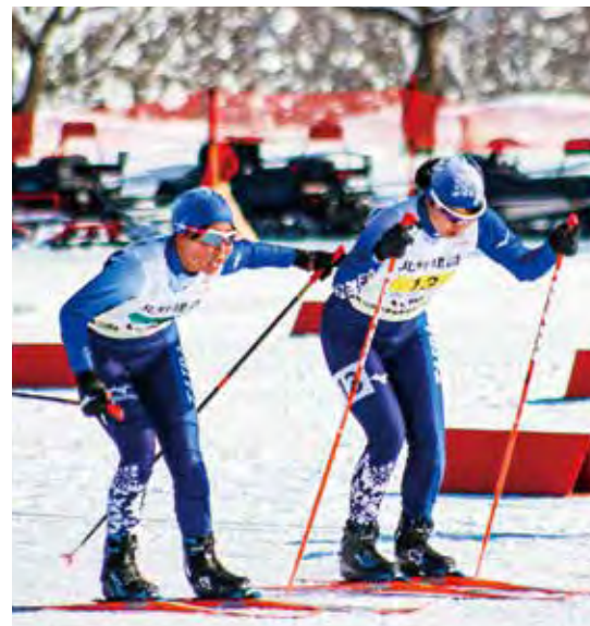
スキー部(クロスカントリー)