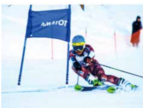
スキー部(アルペン)