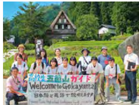
GGS(五箇山ガイド研究会)