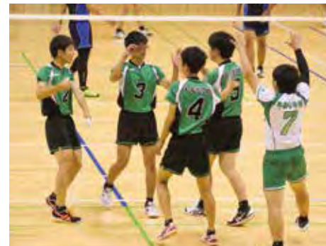
男子バレーボール部